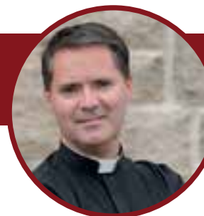
Pfarrer James Mallon Hauptsprecher

Anmeldung und Seminare finden im Bischöflichen Priesterseminar Fulda, Eduard-Schick-Platz 5, 36037 Fulda, statt. Konferenzsaal ist die Orangerie am Schlossgarten, Pauluspromenade 2, beim Hotel Maritim.